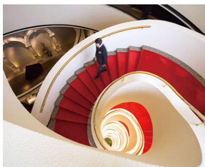
半島會所管理及顧問服務 成立年份：1977年 擁有權：100%