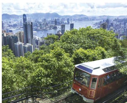
山頂纜車 (香港) 成立年份：1888年 擁有權：100%