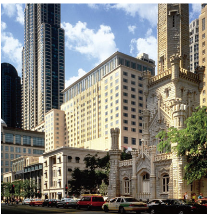
芝加哥半島酒店 成立年份：2001年 房間數目：339 擁有權：100%