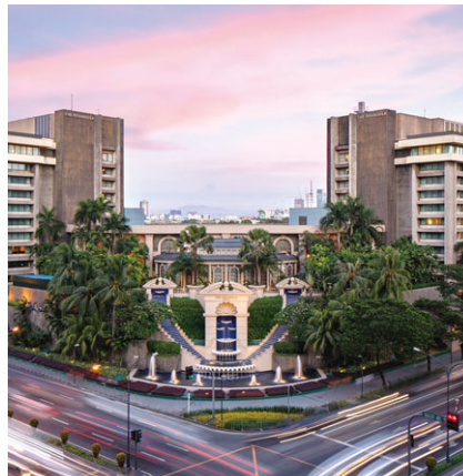
馬尼拉半島酒店 成立年份：1976年 房間數目：469 擁有權：77.4%