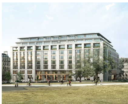
倫敦半島酒店 擁有權：100%