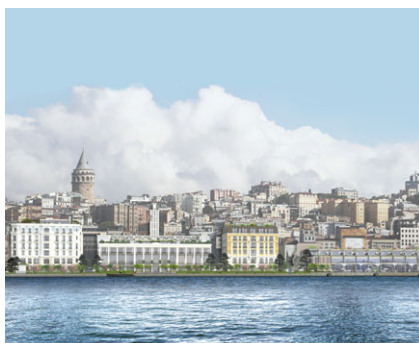
伊斯坦堡半島酒店 擁有權：50%