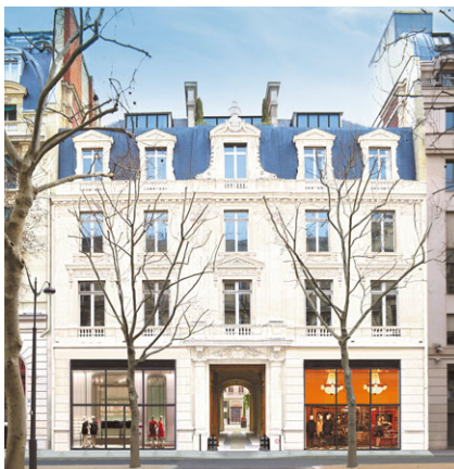
21 avenue Kléber (法國巴黎)