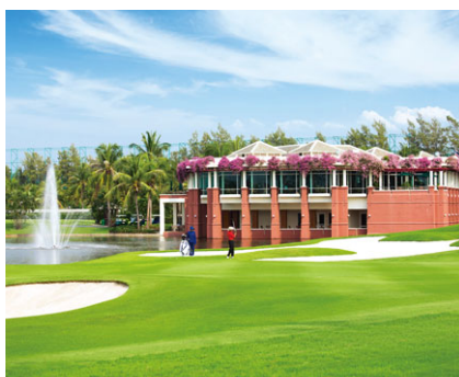
泰國鄉村俱樂部 (泰國曼谷) 成立年份：1996年 擁有權：50%