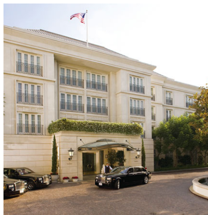
比華利山半島酒店 成立年份：1991年 房間數目：195 擁有權：20%