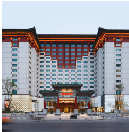
王府半島酒店 成立年份：1989年 房間數目：230 擁有權：76.6%*