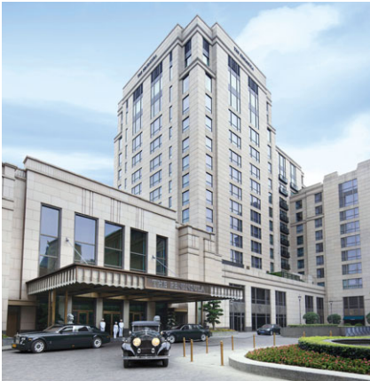
上海半島酒店 成立年份：2009年 房間數目：235 擁有權：50%