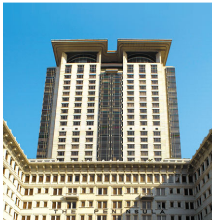
半島辦公大樓 (香港)