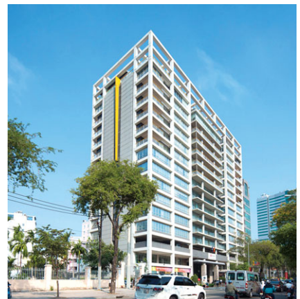
The Landmark (越南胡志明市)