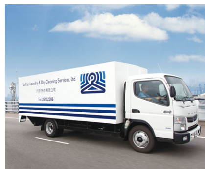
大班洗衣 (香港) 成立年份：1980年 擁有權：100%