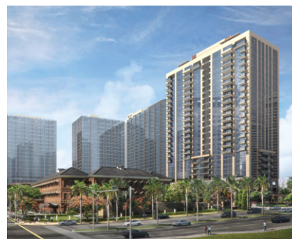
仰光半島酒店 擁有權：70%