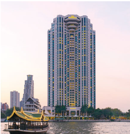
曼谷半島酒店 成立年份：1998年 房間數目：370 擁有權：50%