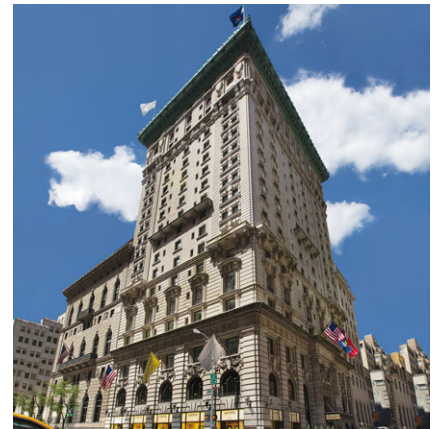
紐約半島酒店 收購年份：1988年 房間數目：235 擁有權：100%