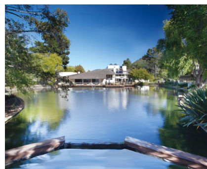
鵝園高爾夫球會 (美國加州喀麥爾) 收購年份：1997年 擁有權：100%