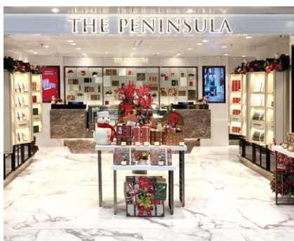
半島商品 成立年份：2003年 擁有權：100%