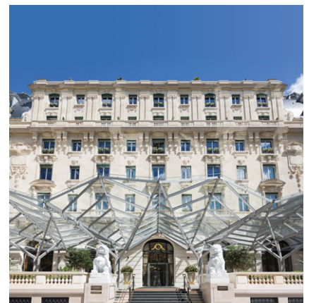
巴黎半島酒店 成立年份：2014年 房間數目：200 擁有權：20%