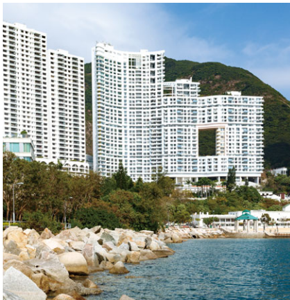
淺水灣影灣園 (香港)